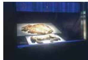
マンモス展ショーケース