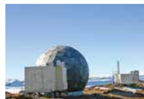
南極・昭和基地で採用される 当社製品