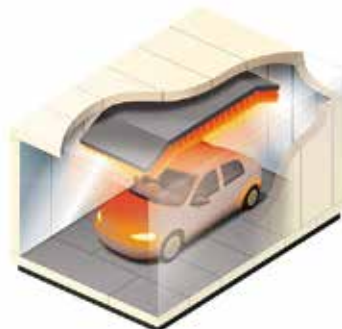
自動車メーカーの性能実験室

東西工業(株)は、技術を追及する礎である「人と人との繋がり」を大切に取り組み、地域をけん引する企業として発展しています。